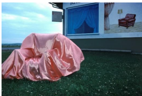
Elfie Semotan_Stilleben.jpg Elfie Semotan, The Happy Printer, Silleben, Burgenland, 1980