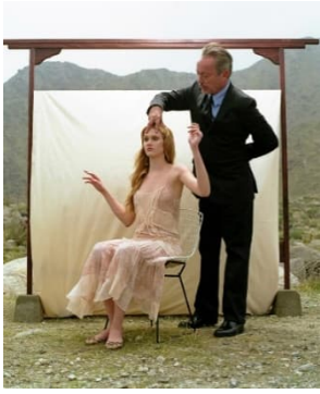
Elfie Semotan_Palm springs California.jpg Elfie Semotan, D la Repubblica delle Donne, Palm Springs California, 2004 © Elfie Semotan